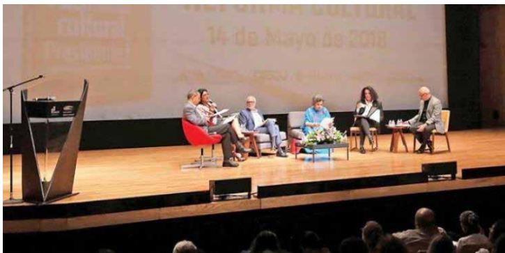
Un diálogo que se espera resulte en beneficio del sector cultural.

Padilla, por su parte, prometió una batería de créditos y apoyos fiscales para empresas culturales, poner un tope al gasto operativo de las instituciones de cultura, un presupuesto del 1% del Presupuesto de Egresos de la Federación (PEF) para el sector, un programa nacional de recuperación de los espacios públicos y una ley de mecenazgo.